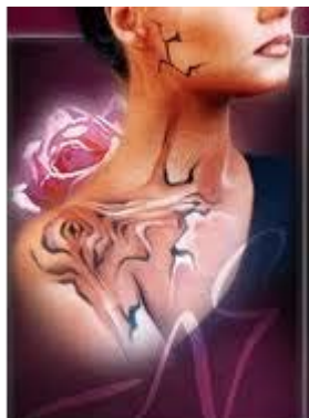
Kuvat 3. Kuvia Cosmetics Norriksen kotisivuilta