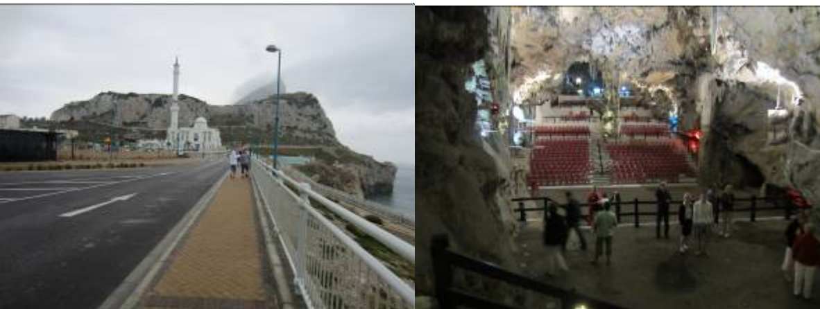
Kuva 6. Gibralttar Espanjan puolelta ja tippukiviluola

Teimme retken myös Gibralttarille. Gibralttar on pieni Englannille kuuluva kaupunki aivan Espanjan etelärannikolla, Andalusiassa. Asukkaita siellä on vajaat 30.000. Kapea Gibralttarin salmi yhdistää Atlantin ja Välimeren, sen kohdalla ei Afrikan ja Gibralttarin väliin jää kuin reilu kaksikymmentä kilometriä. Nousimme minibussilla ylhäälle ihmettelemään niin lähellä olevaa Afrikan rannikkoa, tippukivi luolia kuin luonnossa iloisina kiipeileviä, turisteihin tottuneita, makaki-apinoita.