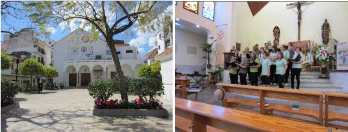
Kuva 4. Los Bolichesin kirkko ja kuoro äänenavauksessa ennen kirkkokonserttia