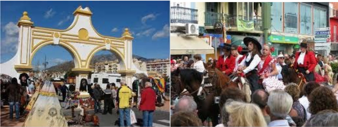
Kuva 5. Kuvia kansainväliseltä Feria juhla-alueelta

kansallisuudet, espanjalaiset mukaan lukien. Viikonlopulle sattui kuitenkin sateiset ilmat, mikä varjosti hieman tunnelmaa ja vähensi kuulemma kävijöitten määrää. Toisaalta paikallinen väestö oli kiitollinen sateesta, sillä talvi oli ollut kuivin moniin vuosiin ja oli pelättävissä että kesästä tulee vaikea, mm. vesisäännöstelyineen, ellei keväällä tule kunnon sateita.