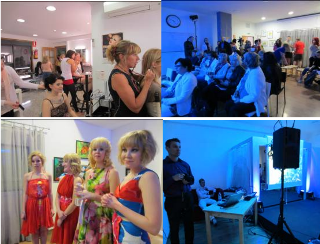
Kuva 6. Sofia-opistolla järjestetyn muotinäytöksen mallien kampaukset ja meikit tehtiin Norriksen meikkikoululla

Loput kaksi päivää pureuduttiin teatterimaskeeraukseen kuuluvan vanhentavan meikin sekä mm. parran, sängin, syylän ja muiden teatteriehostustehosteiden tekemiseen. Vanhentavan meikin lopputulokset kirvoittivat iloisia nauruja, kun jokainen sai nähdä konkreettisesti, miltä sitä kahdeksankymppisenä voisi näyttää, jos ei pitäisi ihostaan kunnolla huolta.