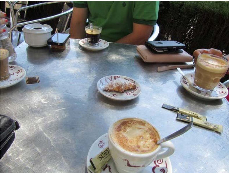
Kuva: Kampuksen viereinen kahvila, itselläni on cafe con leche (edessä oleva kuppi)

edellisen päivän suorituksista ja miten heidän pitäisi parantaa nykyistä suhtautumista opiskeluihin. Lukuvuosi maksaa 8000 euroa, jonka vanhemmat maksavat. Jos he eivät läpäise kurseja niin vanhemmat joutuvat maksamaan lisämaksun.