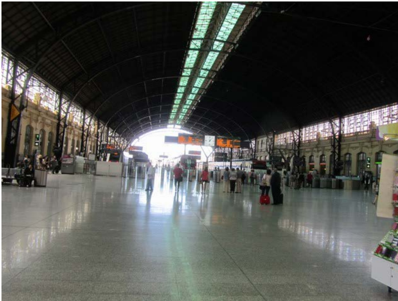
Kuva: Valencia Nort junasemalla

Valencia on kolmanneksi suurin kaupunki Espanjassa, lähes miljoona asukasta. Catarroja on 8 km Valencian keskustasta ns. lähiöalue, jossa on paljon teollisuutta ja kerrostaloja, joissa paikallinen väki asuu. Alueella ei ole omakotitaloja.