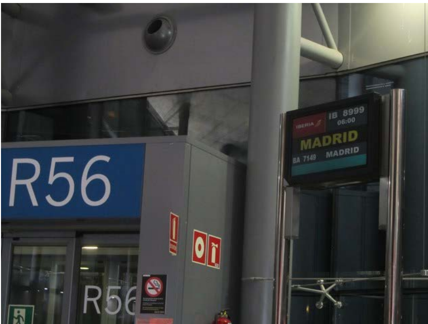
Kuva: Valencian kentällä kotimatka alkamassa

Matkustuspäivä kohti kotisuomea alkoi anivarhain. Herätys oli 02.00 ja taksi tuli hakemaan 03.15 hotellilta. Nukuin huonosti, sillä ikkuna oli auki ja ulkoa kuului lähes koko yön melua. Valencian kentällä ei tarvitse olla ainakaan aamusta kahta tuntia ennen, sillä lähtöselvitys alkoi 1,5 tuntia ennen lähtöä. Madridissa odottelin reilut kolme tuntia Helsingin jatkolentoa ja kohti Kuopiota kone lähti klo 17. Menin lentobussilla lisälmeen, josta autolla kotiin Pyhäjärvelle.