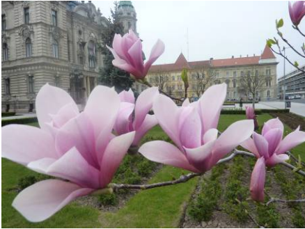
Győrin kaupungin kukkaloistoa