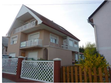
Zircin talo aitoineen

Viikonloppuisin meille oli järjestetty paljon erilaista ohjelmaa: kaupunkivierailuja, Pápan kylpylässä saunomista, Vinyessä patikoimista ja Pannonhalman luostariin tutustuminen. Opiskelijoiden kanssa kävimme kaksi kertaa Budapestissä. Ensimmäisellä kerralla menimme bussilla ja tutustuimme Magyar Természettudományi Múzeumiin (luonnontieteellinen museo) ja eläintarhaan. Toisella kerralla matkustimme junalla ja Budapestissä liikuimme metrolla ja raitiotievaunulla. Tutustuimme perinteiseen ja kuuluisaan Restaurant Gundel -ravintolaan. Postimuseossa, Múzeum Tímea Pipó, saimme historiaa postilaitoksen kehityksestä. Oman ”rahan ” saimme painettua kansallispankissa, Nationalbank.