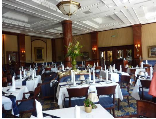
Gundel -ravintola Budapestissä