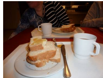
Aamupala -atria lauantaimakkaralla ja hunajalla, juomana sitruunatee

Lounas koostuu aina alkukeitosta, joka on liemipohjainen. Keitossa on kuutiokasviksia ja aina erilaista makaronia. Toinen, vahvempi ruoka on makaronia, perunaa, riisiä tai kaalia lisäksi voi olla lihaa. Liharuokana on unkarilaista pörkölttiä, joka valmistetaan possunlihasta. Liha leikataan ja jauheliha jauhetaan keittiöllä. Jauhelihapihvitaikina valmistettiin keittiöllä ja saimme pyöritellä jauhelihapihvejä. Jauhelihapihvit samoin kuin possunleikkeleet uppoaistetaan auringonkukkaöljyssä. Broilerinkoivet paistettiin uunissa. Perunat kuorittiin keittiöllä ja samoin puhdistettiin kaalit. Pakasteena tulivat kuutiokasvikset. Meidän työskentelyaikana kalaa eikä tuoreita kasviksia käytetty.