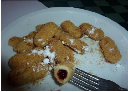
Päivällisruoka luumutäytteiset nuudelit