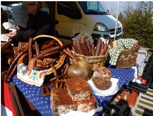
Veszprémin markkinoilla lihajalosteita