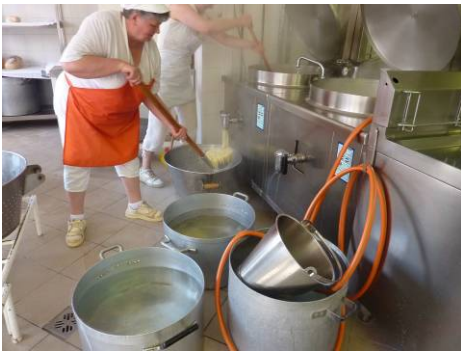
Keittäjä kauhoo makaronia

Työskentely keittiöllä on fyysisesti raskasta. Kippikattilat ovat kiinteitä ja juokseva ruoka tulee hanan kautta, muu ruoka on kauhottava kattilasta. Lattialla huuhdellaan ruokatarvikkeita sekä raakoja että kypsiä. Irtokattiloita ja paistinpannuja käytetään ruoanvalmistukseen. Kattilat ovat isoja ja raskaita nostella. Ruoka kypsennetään kaasulla. Keittiöllä ilmanvaihto oli vähäistä ja valaistus heikkoa.