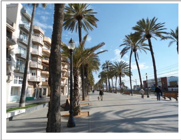
Rantabulevardi Badaloonassa torstaiaamuna 27.3. matkalla tapaamiseen

Lähdin matkaan keskiviikkoamuna 26.3. klo 5.30 Oulusta ja saavuin Badaloonaan illalla klo 20.30.