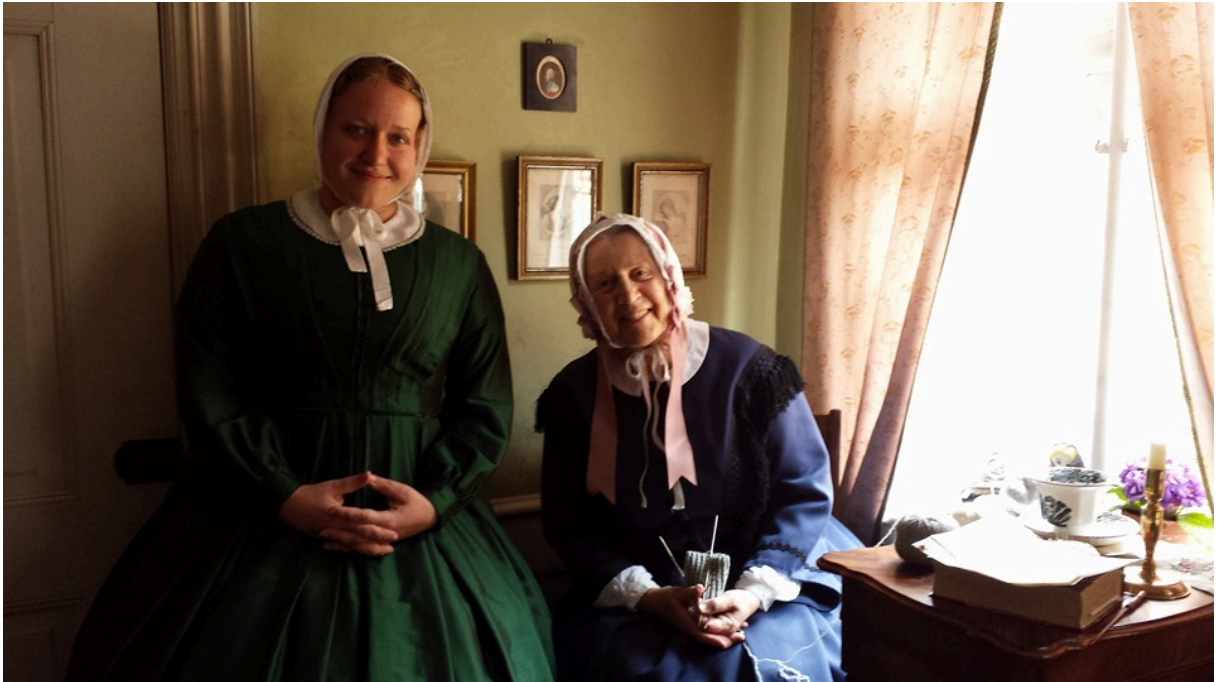
Ylläoleva kuva Aarhus:sta, Vanhasta Kaupungista