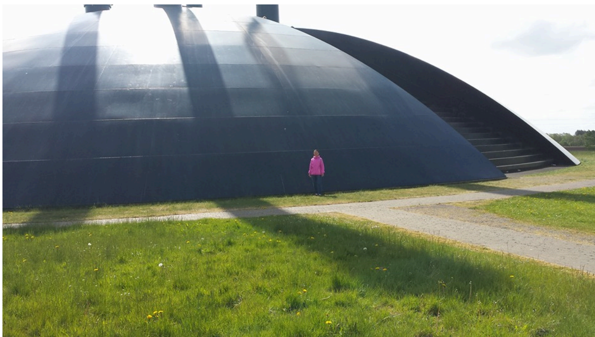
Ylläoleva kuva on Elia- patsas..Kaupungin ylpeys.

Todella mukavaa on ollut huomata miten pikkuhiljaa yhä useammat työkaverit tulevat juttelemaan englanniksi ja hyvin harvoin olen tuntenut itseni ulkopuoliseksi. Voin suositella lämpimästi opiskelua ulkomailla. Hyvin paljon riippuu sinusta itsestäsi. Hyviä käytöstavat, toisen kunnioittaminen ja kohteliaisuus sekä positiivinen asenne elämään, niillä pärjää kyllä.