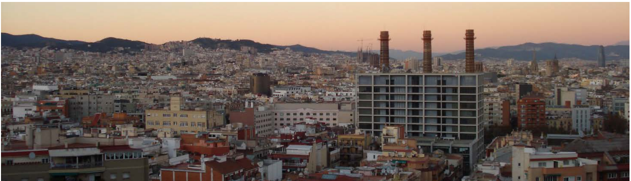
Kuva 1. Näkymä Monjuic vuorelta

Barcelona on Espanjan toiseksi suurin kaupunki pääkaupunki Madridin jälkeen. Se on itsehallintoalue Katalonian pääkaupunki ja asukkaita siellä on noin 1,6 miljoonaa. Jos mukaan lasketaan kaikki Suur-Barcelonan alueella olevat kunnat ( kuten Molins de Rei ), asukasluku nousee noin 3,2 miljoonaan. Barcelonan alueella, kuten muuallakin Kataloniassa on kaksi virallista kieltä, jotka ovat Espanja ja Katalaani.