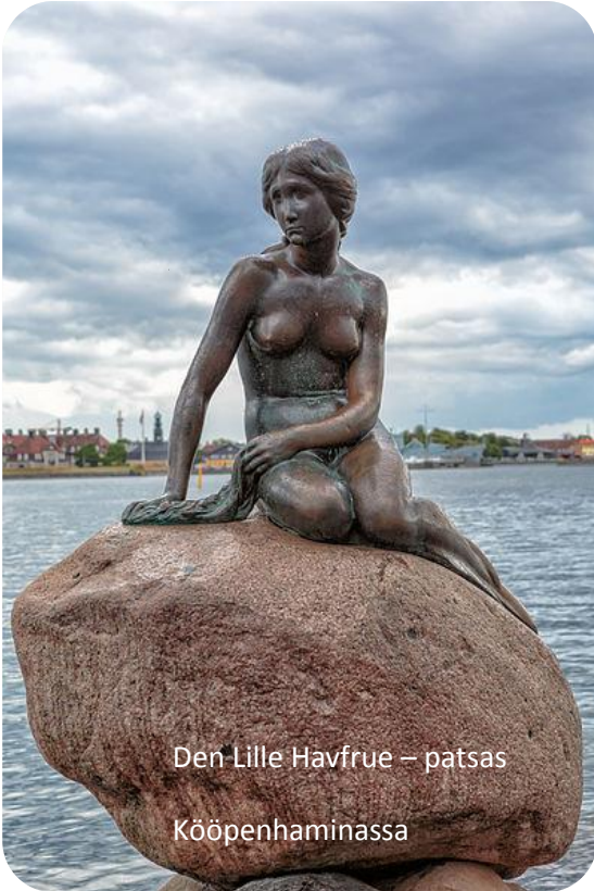
Den Lille Havfrue – patsas Kööpenhaminassa