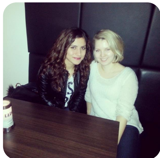
Syömässä vaihtarikaverin kanssa