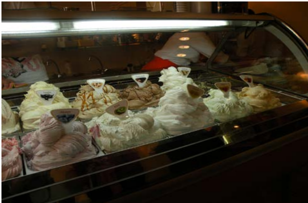
Kuva 4. Jäätelöä Székesfehérvárissa

Vapaa-aikani vietin kierrellessä Unkaria Várpalotan lähikaupungeissa. Jonain viikonloppuina olin unkarilaisten mukana tutustumassa perheisiin ja toisina taas menin bussilla lähikaupunkiin Zirciin tapaamaan suomalaisia tyttöjä. Paikkoja, joissa työssäoppimisjaksoni aikana kävin, olivat mm. Budapest, Balatonjärvi, Vészfővár, Székesfehérvár, Zirc, Pannonhalma ja Győr.