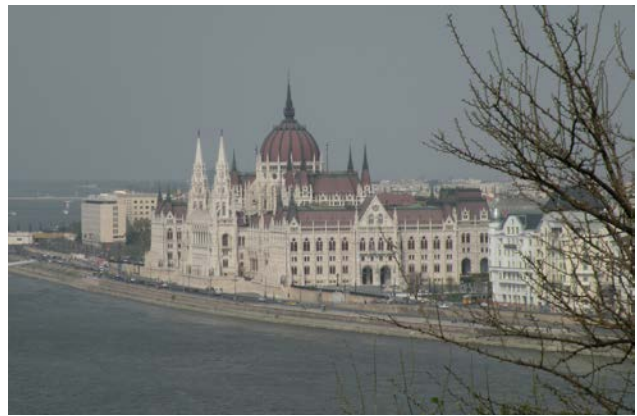
Kuva 5. Unkarin parlamenttitalo Budapestissä