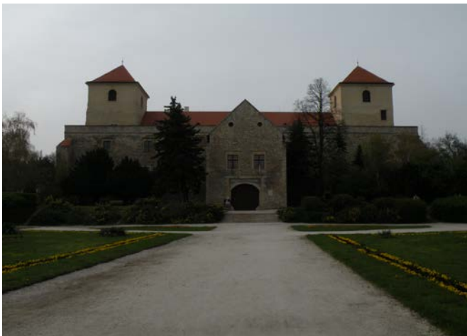
Kuva 1. Thury-vár -linna Várpalotassa

Unkari on Keski-Euroopassa oleva sisämaavaltio ja sen naapurimaat ovat Romania, Slovenia, Slovakia, Kroatia, Serbia, Ukraina ja Itävalta. Unkarin pinta-ala on 93 028 neliökilometriä, asukasluku noin 10 miljoonaa ja sen pääkaupunki on Budapest (1 695 000 asukasta). Unkarin virallinen kieli on suomalais-ugrilainen unkarin kieli. Valuutta on unkarin forintti.