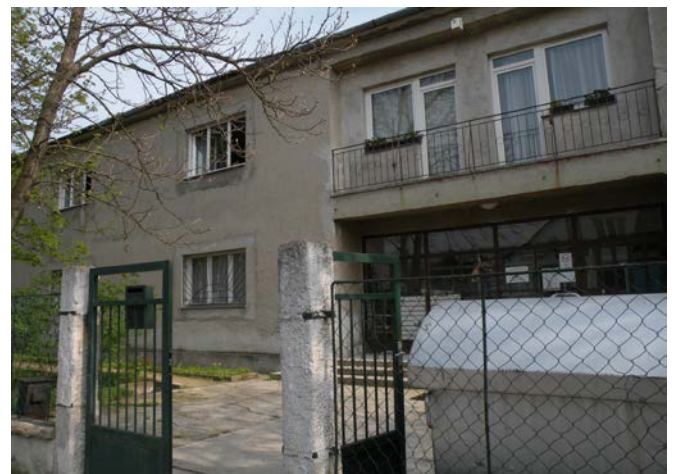
Kuva 2. Opiskelija-asuntola Várpalotassa