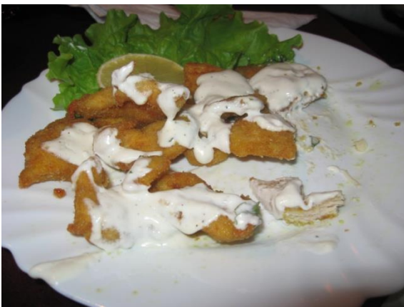
Valkosipuli kanaa Ronissa

Viikonloppuisin ja tarvittaessa illalla ravintola vaihtoehtoina olivat Skorpio ja Roni josta kummastakin sai hyvää ruokaa. Löysimme myös ravintolan jossa tarjoilija ei osannut englantia, mutta eräs ystävällinen nainen joka puhui englantia auttoi meitä tilaamaan erittäin hyvää spagettia ja jälkiruoaksi erittäin makeat suklaakakkupalat.