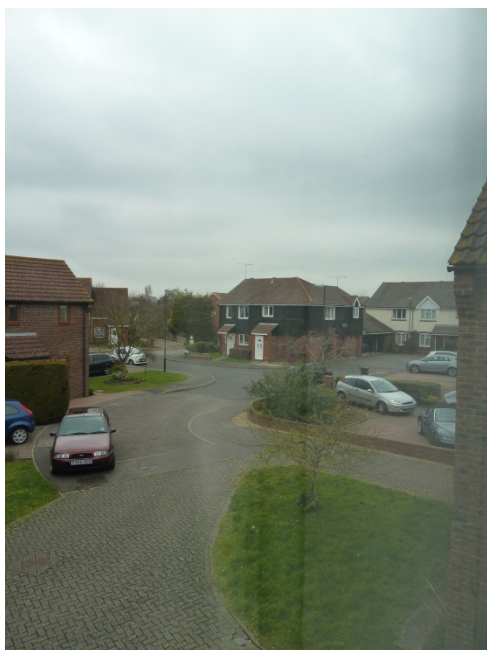
Maisemaa Englantilaisesta asutuksesta Chichesterissä

Vapaa-aika sujui Chichesterin kaupunkiin tutustuessa, paikan tavoille opetellessa, esimerkiksi toispuoleinen liikenne aiheutti välillä ”oikosulkuja” päässä. Chichester antoi kyllä todella hyvän kuvan, koska se oli viihtyisä, pieni kaupunki, johon oli todella helppo sopeutua.